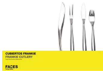
Display Cubertería Cutlery Display