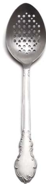
Cuchara con pinza Clothes-peg spoon MEN 3.5.2 elBulli