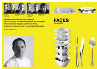
Display 30 x 42 cm