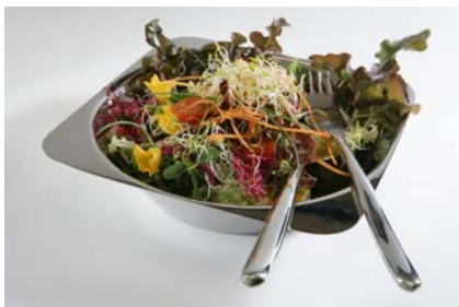
Bol grande Big Bowl